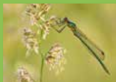
Habiter dans un Parc naturel