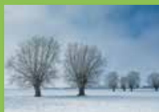
Pourquoi un Parc naturel?