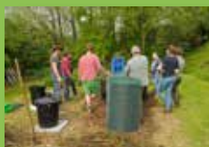
Le Parc naturel en action